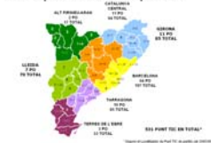
El mapa de la xarxa punt tic

Aprofitem aquesta circular per informar que estem treballant en l'organització de la trobada territorial per vegueries dels dinamitzadors i dinamitzadores de la Xarxa Òmnia en la que volem que hi participin altres punts TIC.